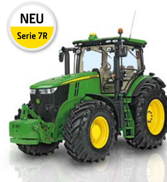
NEU Serie 7R