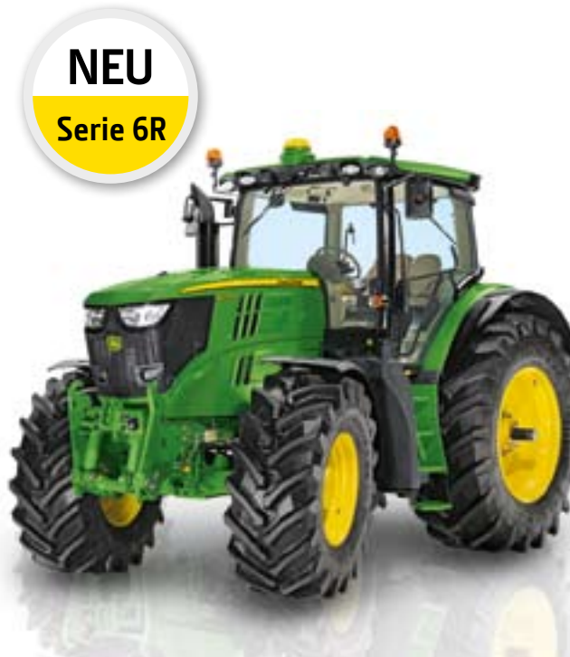
NEU Serie 6R