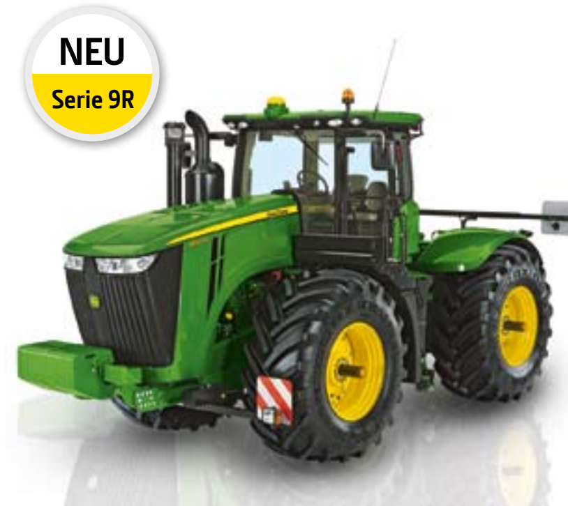
NEU Serie 9R