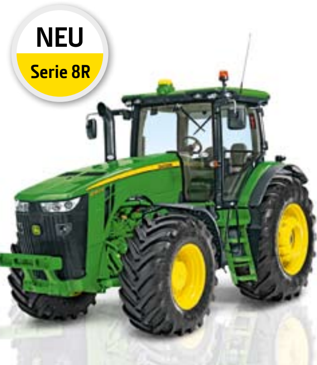
NEU Serie 8R

Mit seinen sensationellen neuen Produkten auf allen Gebieten der Landtechnik demonstriert John Deere ein weiteres Mal seine Innovationsstärke. Erkundigen Sie sich noch heute bei Ihrem John Deere Vertriebspartner über Einzelheiten.